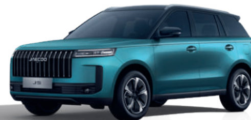
ZÖLD DUÓ (Z6)