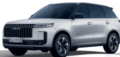
FEHÉR DUÓ (ZE)