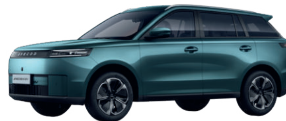
ALPESI ZÖLD (LQ)