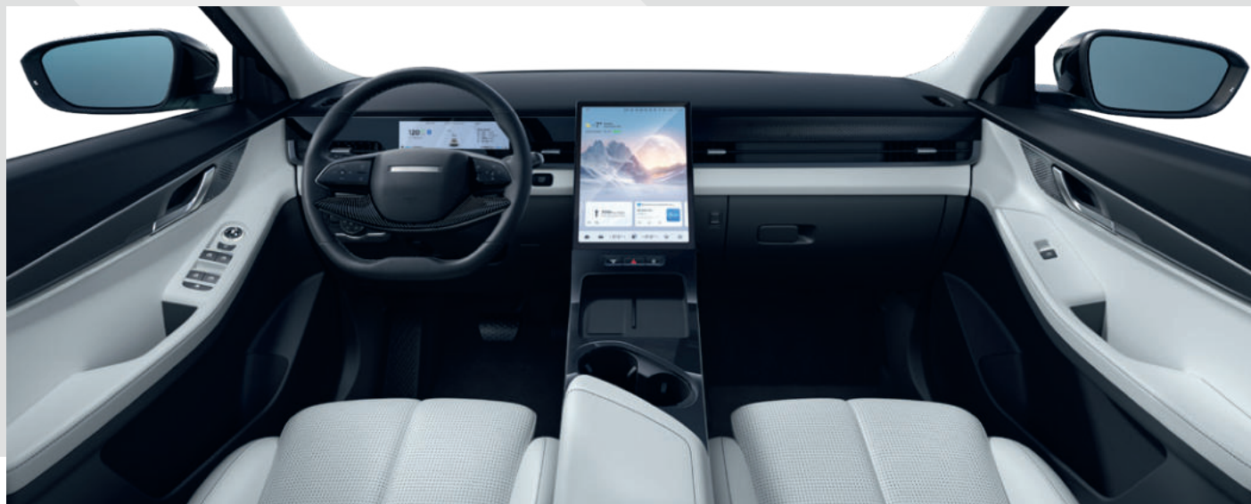
HAMUFEHÉR ÉS FEKETE BELTÉR - 150 000 FT