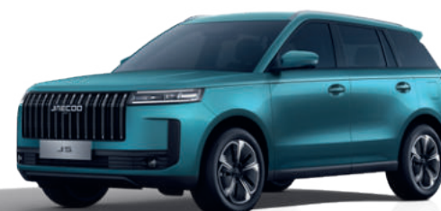
ALPESI ZÖLD (LQ)