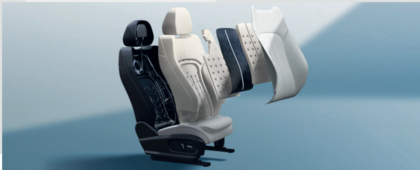
FŰTHETŐ ÉS SZELLŐZTETHETŐ ELSŐ ÜLÉSEK