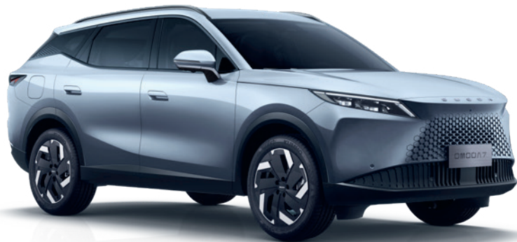
HOLDFÉNY EZÜST (KU)